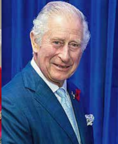
Król Karol III

Wielka Brytania jest monarchią parlamentarną z rządem odpowiedzialnym przed parlamentem. Stolicą państwa jest Londyn. Obecnym monarchą brytyjskim jest król Karol III, który zasiadł na tronie 8 września 2022 roku po śmierci swojej matki królowej Elżbiety II.